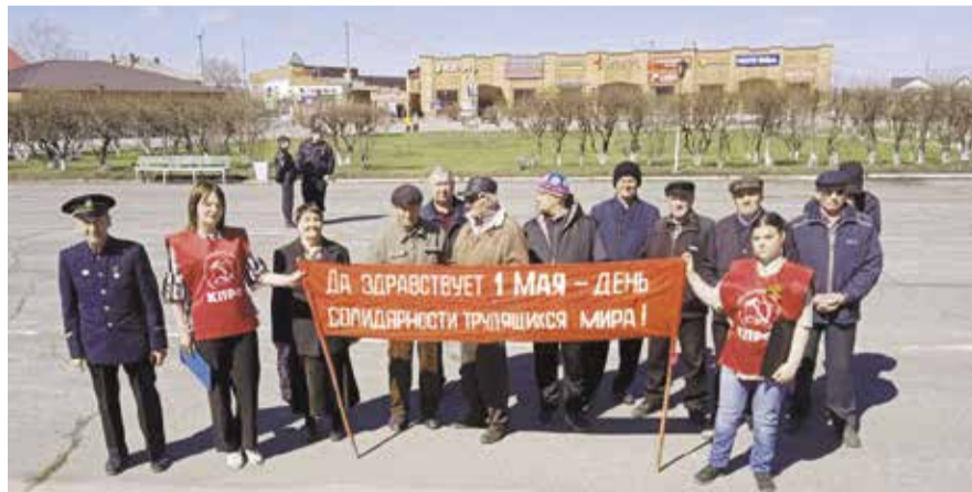
НА ФОТО: ПЕРВОМАЙ В ТАТАРСКОМ РАЙОНЕ