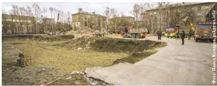
НА ФОТО: СТРОИТЕЛЬНЫЕ РАБОТЫ НА МЕСТЕ БУДУЩЕЙ ШКОЛЫ

Не менее важная поправка касается долгожданного строительства нового здания 54-й школы. В прошлом году здание было снесено, поскольку было признано аварийным, а ученики — распределены по соседним школам, так,