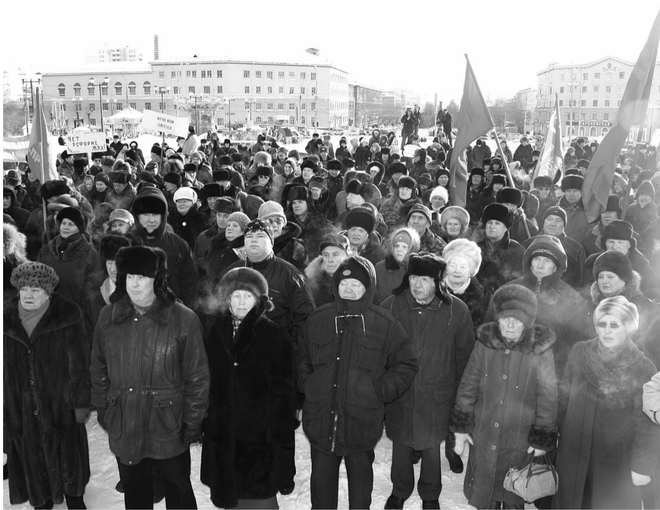
● НА ФОТО: АКЦИЯ ПРОТЕСТА СОСТОЯЛАСЬ, НЕСМОТЯ НА БУДНИЙ ДЕНЬ И ОЩУТИМЫЙ МОРОЗ