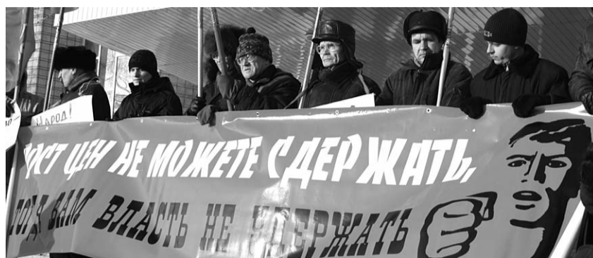
● НА ФОТО: НУЖНА НАРОДНАЯ ВЛАСТЬ!

«Наш митинг — это ответ антикризисным мерам правительства Путина. Сегодня мы видим рост безработицы, остановившиеся предприятия, элеваторы, забитые зерном двухгодичной давности, замороженную заработную плату бюджетникам и рост цен и тарифов ЖКХ. Вот результаты деятельности нашего правительства. Казна пустеет, Стабилизационный фонд тоже, а количество долларовых миллиардеров удвоилось! Кто-то неплохо набил себе карманы во время кризиса. 27 человек из списка миллиардеров являются депутатами Госдумы, сенаторами и состоят в партии «Единая Россия». Именно поэтому мы говорим, что работа правительства неэффективна, и оно должно уйти в отставку. Правительство не справилось со своей этой задачей. Виновных