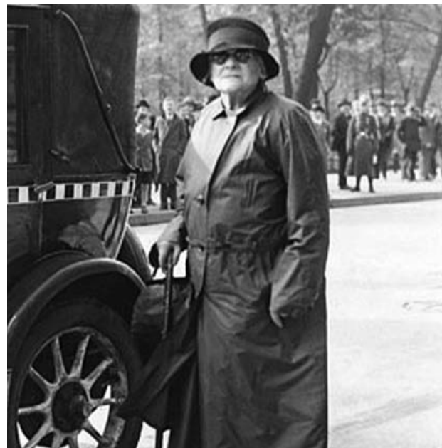
● НА ФОТО: КЛАРА ЦЕТКИН

Кто у нас в стране составляет основное число безработных? Кого не принимают на работу? В первую очередь, беременные женщины, а также имеющих малолетних детей. И прежде всего женщинам предлагают низкие зарплаты и менее ответственные должности, зачастую совершенно не отвечающие их профессиональному потенциалу. Из-за экономического кризиса пострадали больше всего именно те сферы, в которых работало