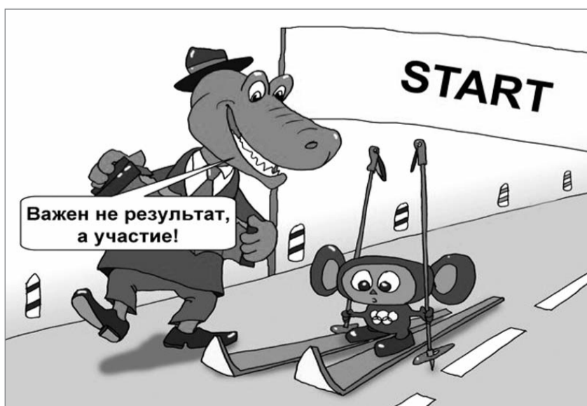
рис. с сайта CARICATURA.RU