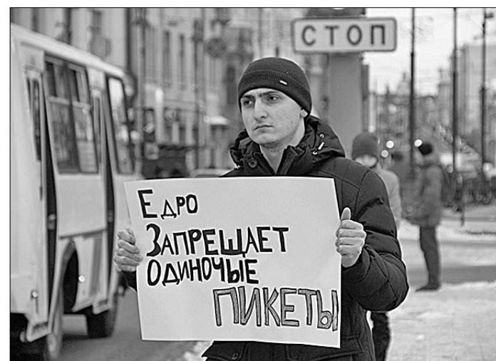
Пресс-служба Новосибирского обкома КПРФ.

С момента избрания на должность красного руководителя совершаются нападки со стороны СМИ, саботируется работа исполнительных органов и организаций. Противники КПРФ до сих пор не могут смириться с тем, что выборы прошли легитимно и народ избрал своего кандидата, — сообщают комсомольцы на официальном сайте.