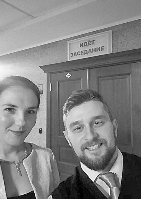
Пресс-служба Алтайского крайкома КПРФ.

Будем обжаловать это решение в следующих судебных инстанциях, вплоть до Европейского суда по правам человека.