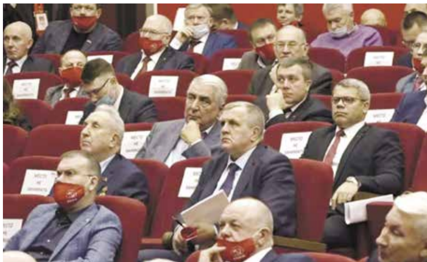
НА ФОТО: УЧАСТНИКИ ПЛЕНУМА