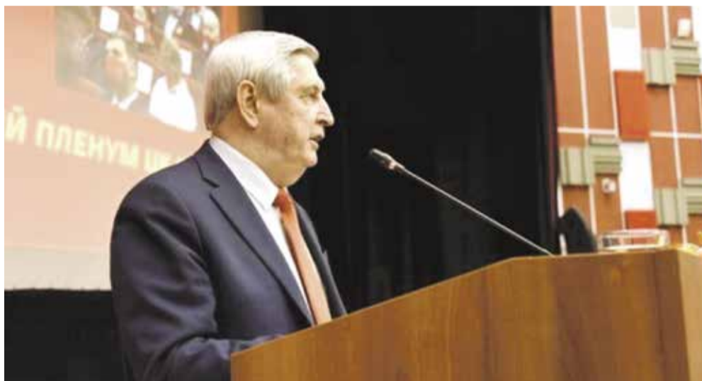
НА ФОТО: ПЕРВЫЙ ЗАМЕСТИТЕЛЬ ПРЕДСЕДАТЕЛЯ ЦК КПРФ ИВАН МЕЛЬНИКОВ ВЫСТУПАЕТ НА ПЛЕНУМЕ

Третья кампания: вокруг новой редакции Конституции. Поддержав само намерение совершенствовать Основной закон, мы единственные не согласились ни с тем, как это делалось, ни с тем, что было сделано. Наши 15 ключевых поправок, затрагивающие коренные интересы большинства, были