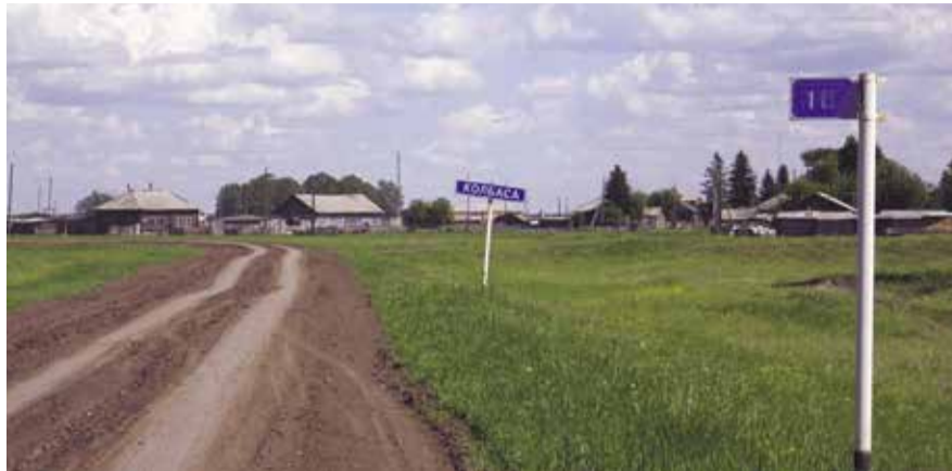
НА ФОТО: ВЪЕЗД В ДЕРЕВНЮ КОЛБАСА (КЫШТОВСКИЙ РАЙОН)

Хочется обратиться ко всем читателям газеты «За народную власть!», ко всем, кому безразлична судьба России и особенно самого отсталого по всем показателям в регионе Кыштовского района. От выборов к выборам ничего в районе не меняется в лучшую сторону.