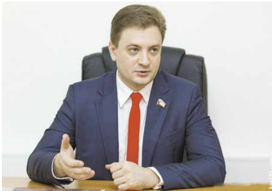
НА ФОТО: ГЕОРГИЙ КАМНЕВ

Несмотря на рапорты руководства «Единой России» о своих успехах, «партия власти» чувствует, что ходит по крайне тонкому льду. Иначе и не объяснить столь нервную реакцию от председателя Госдумы Володина на выступление члена фракции КПРФ в Госдуме Георгия Камнева, посвященное последним «выборам» (кавычки здесь не зря).