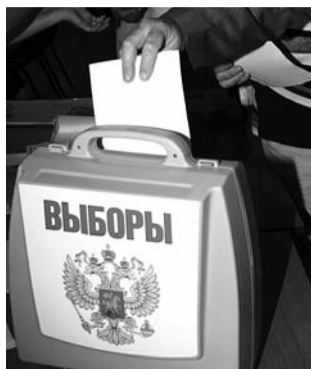
● НА ФОТО: ИНСТРУМЕНТ ФАЛЬСИФИКАЦИИ

В адрес редакции пришло письмо от нашего читателя, который требует внести в законодательство о выборах в части организации досрочного голосования изменения, чтобы предотвратить фальсификации.