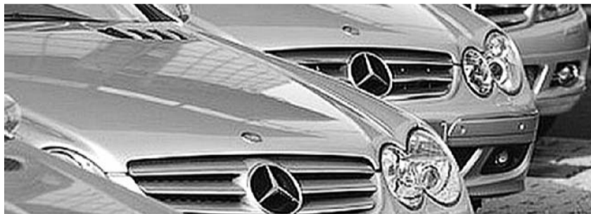
● НА ФОТО: ЛЮБИМАЯ ПРАВИТЕЛЬСТВЕННАЯ МАШИНА

бым у нас является вовсе не сам факт их вымогательства, а отношение к этому факту нашей общественности и нашего чиновничества, включая и компетентные органы.