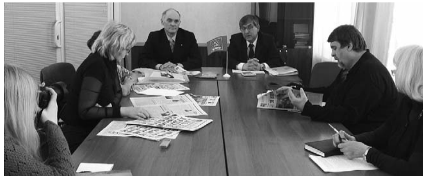
● НА ФОТО: ПРЕСС-КОНФЕРЕНЦИЯ БЕРДСКОГО ГОРКОМА КПРФ

по-прежнему правящей партией повсеместно использовался административный ресурс через районные администрации, с привлечением ими сотрудников социальных служб, медицинских работников, средств СМИ, предварительной «зачисткой» кандидатов и т.д. Несмотря на это, коммунистам удалось одержать 6 побед в Горсовет Новосибирска, получить 43 мандата в районных Советах.