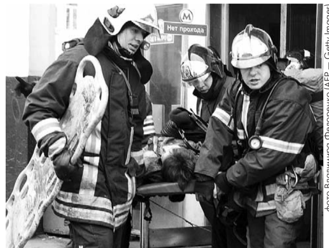
● НА ФОТО: СПАСАТЕЛЬНАЯ ОПЕРАЦИЯ В МОСКОВСКОМ МЕТРО

Московские взрывы 29 марта произошли на фоне усиливающегося внутриэлит-