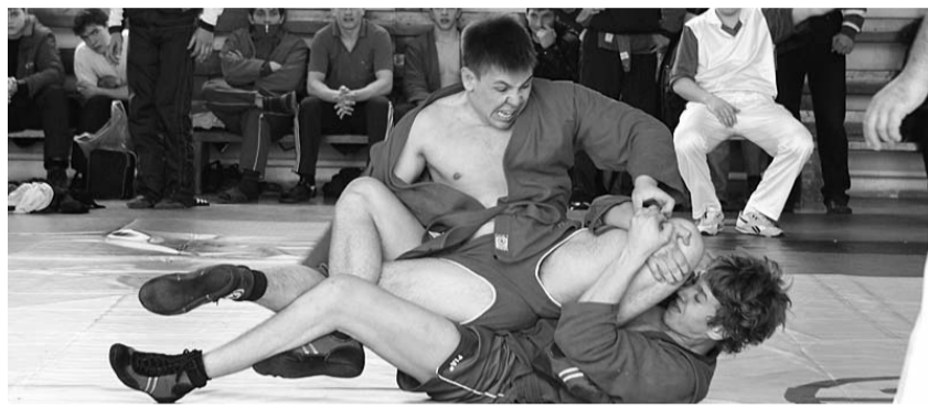
● НА ФОТО: ТУРНИР В САМОМ РАЗГАРЕ!