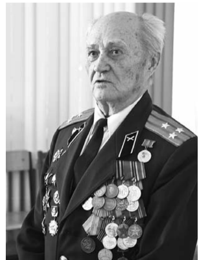
● НА ФОТО: БОРИС ПРОКОПЬЕВИЧ ЗАЙЦЕВ