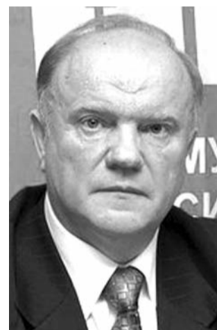
● НА ФОТО: ЛИДЕР КПРФ

Председатель ЦК КПРФ Геннадий ЗЮГАНОВ считает, что покончить с терроризмом в России можно, если сочетать активную оперативную работу силовых структур с мерами по улучшению социально-экономического положения северокавказских регионов.