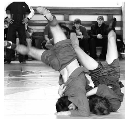
● НА ФОТО: УДАЧНЫЙ БРОСОК