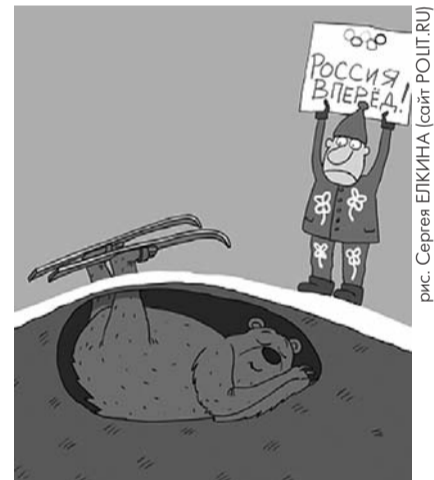
● НА РИС.: НАША ОЛИМПИЙСКАЯ КОМАНДА