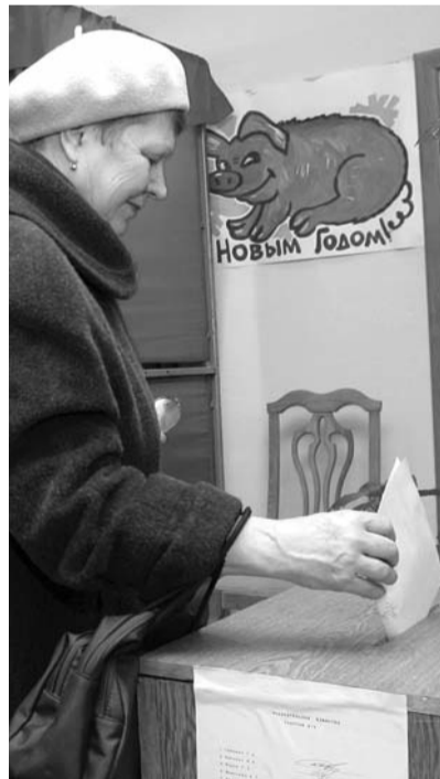
● НА ФОТО: ОТКУДА ИЗБИРАТЕЛИ ДОЛЖНЫ УЗНАВАТЬ ИНФОРМАЦИЮ О КАНДИДАТАХ ПРИ ТАКОМ ЗАКОНЕ «О ВЫБОРАХ»?

Тем не менее, виноватым оказался именно кандидат, пытавшийся донести до избирателей свои агитационные материалы. Местный мировой судья по пред-