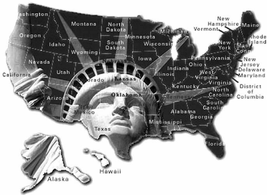
● НА РИС.: ТАКОЕ БУДУЩЕЕ НАС ЖДЕТ?

В СССР были разные реорганизации. В начале 60-х годов при укрупнении совнархозов был создан Западно-Сибирский СНХ с объединением промышленности Омской, Томской и Новосибирской областей. Однако зарплата у руководящих работников Совнархоза осталась прежней. Кстати, председатель Совнархоза имел зарплату всего в 4 раза больше, чем