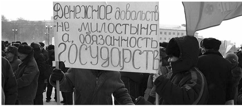
● НА ФОТО: ТЕПЕРЬ ЗАЩИТНИКАМ РОДИНЫ САМИМ НУЖНА ЗАЩИТА

— От имени Коммунистической партии Российской Федерации тепло поздравляю всех присутствующих с Днем Советской Армии и Военно-Морского флота! Именно так и никак иначе. Сегодня мы празднуем 92-ю годовщину со дня создания Красной