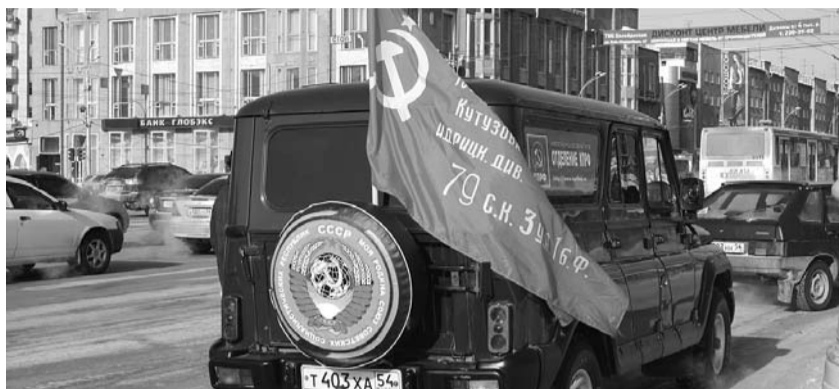
● НА ФОТО: С АЛЫМИ ФЛАГАМИ — ПО ГОРОДУ!

— От имени Центрального комитета Коммунистической партии я поздравляю всех с девяносто второй годовщиной Советской Армии и Военно-Морского флота. Как бы праздник не назывался, сегодня — «День защитника отечества», завтра в чью-нибудь большую голову придет другое название, но мы всегда будем помнить, что это годовщина Советской Армии. В 1918 году под Псковом и Нарвой