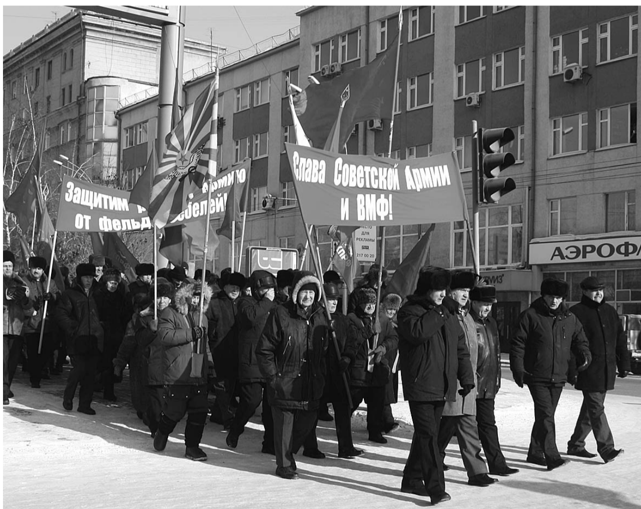
● НА ФОТО: ТОРЖЕСТВЕННОЕ ШЕСТВИЕ ПОД ЗНАМЕНАМИ КПРФ