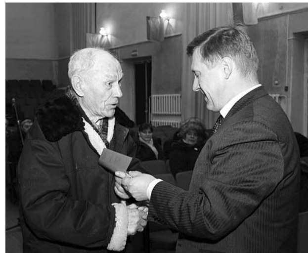
● НА ФОТО: АНАТОЛИЙ ЛОКОТЬ НАГРАЖДАЕТ ВЕТЕРАНА В КАРГАТЕ

«Особенно это касается высказываний министра сельского хозяйства Елены СКРЫННИК . Когда она говорит о рекордных урожаях, о программе поддержки фермерства, мы задаем ей вопрос: а что же делать с 4 миллионами тонн зерна, которое лежит на элеваторах в нашей области, куда его девать? Будем ли мы сеять зерно в следующем году? Почему до сих пор нет серьезного кормового производства? На эти вопросы мы не получаем четких ответов. За министра Скрынник отвечают ее заместители или подсказывают ей ответ. Ну как врач по образованию может руководить всем сельским хозяйством страны,