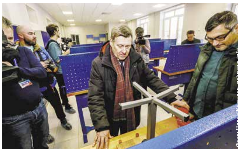
НА ФОТО: АНАТОЛИЙ ЛОКОТЬ ПРОВЕРЯЕТ СТРОИТЕЛЬСТВО ШКОЛЫ №221