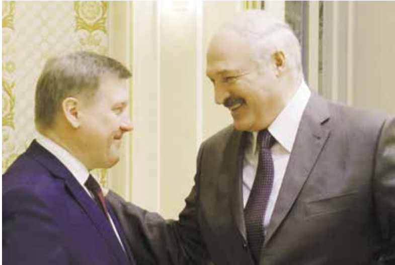
НА ФОТО: АНАТОЛИЙ ЛОКОТЬ И ПРЕЗИДЕНТ РЕСПУБЛИКИ БЕЛАРУСЬ АЛЕКСАНДР ЛУКАШЕНКО

Поэтому какие бы ни были политические разногласия