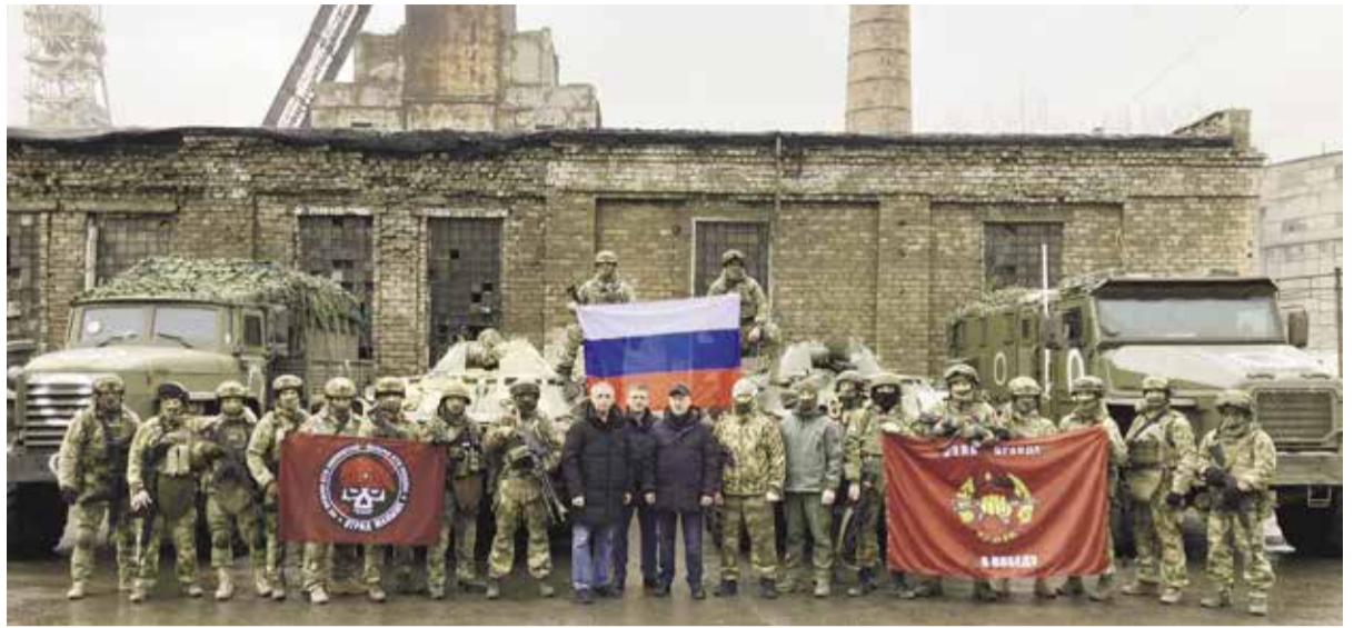
НА ФОТО: РАБОЧАЯ ПОЕЗДКА В БЕЛОВОДСКИЙ РАЙОН ЛНР

Естественно, мэр-коммунист всегда подчеркивал, что Новосибирск как крупнейший научный, промышленный